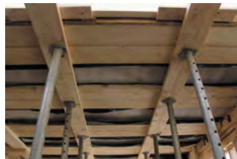
Залог качества перекрытий – точность и аккуратность при устройстве опалубки