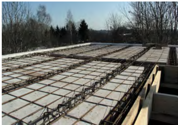
Вариант перекрытия с балками, перевязанными с арматурой поверхностной стяжки, обеспечивает максимальную прочность. Проект 1231-0