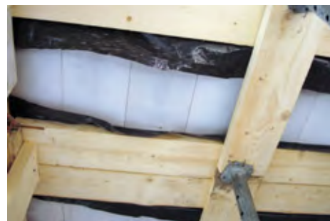
Доски опалубки защищаются плотным полиэтиленом и затем могут использоваться, например, для стропильной системы дома