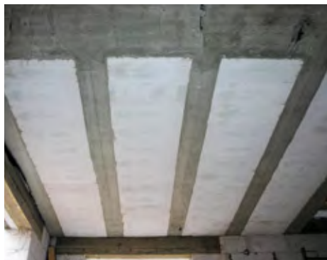
В итоге балки перекрытий и блоки газобетона образуют монолитную поверхность потолка без швов