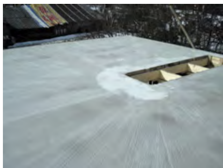
При взгляде сверху готовое перекрытие ничем не отличается от монолитного

Экономить в процессе создания сборно-монолитных перекрытий можно разными способами. Здесь применяется тот же газобетон, что заказывается для возведения стен, а значит, не требуется дополнительная поставка материалов. Дополнительной закупки пиломатериалов для опалубки тоже можно избежать. Эти доски, которые покрываются полиэтиленом и после демонтажа остаются совершенно чистыми, в дальнейшем могут пойти на создание стропильной системы. По сути, требуется арендовать лишь телескопические стойки для поддержания конструкции, а это совсем небольшие расходы.