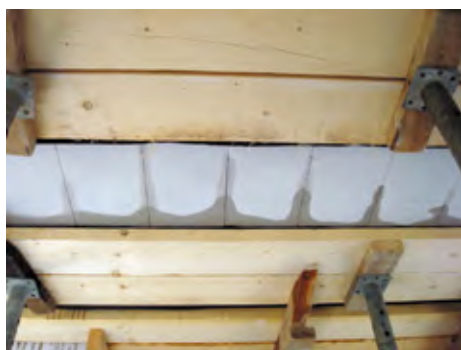
Цементное молочко, проникающее между блоками при заливке бетона, надежно связывает блоки между собой

В итоге балки перекрытий и блоки газобетона образуют монолитную поверхность потолка без швов