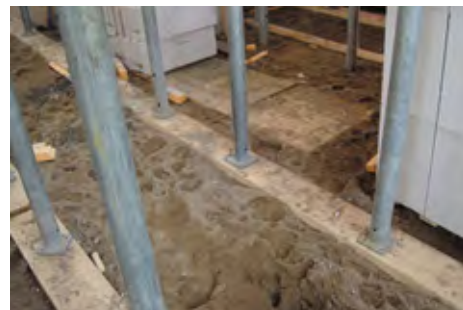
Если фундамент ленточный, особенно важно обеспечить прочность основания под опалубку перекрытий