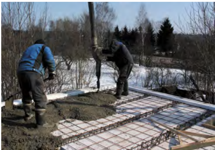
При выполнении заливки бетоном важно соблюдать аккуратность и недопускать смещения блоков